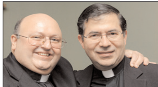
Padre Frank Pavone y Padre Victor Salomón

Sacerdotes por la Vida es sostenido completamente Por individuos comprometidos como usted. Cada dólar es Usado para salvar vidas y educar al pueblo. Haga donaciones En la Internet en www.priestsforlife.org/donate , o envíe cheques pagables a "Priests for Life" to PO Box 141172, Staten Island, NY 10314